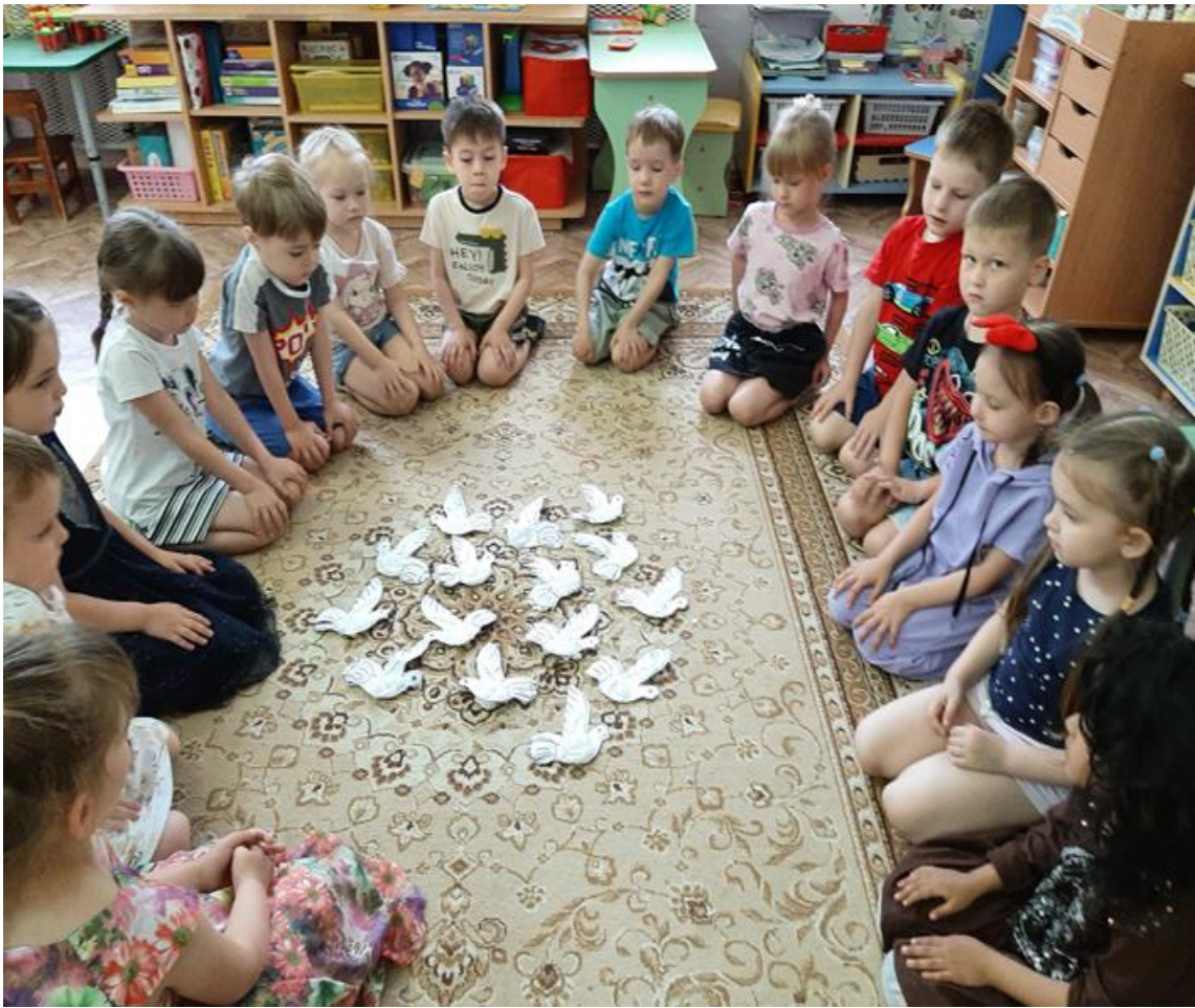
Выставка поделок из природного материала